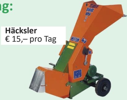
Häcksler € 15,- pro Tag