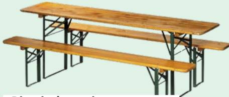
Biertischgarnituren (bis zu 15 Stück) pro Garnitur € 5,- pro Tag