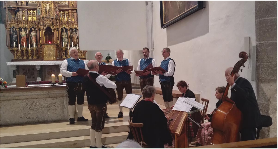
Festlich umrahmt wurde der Gottesdienst zu Ehren unserer verstorbenen Mitglieder am Sonntag, 22. Oktober, von der Neuzeuger Messerer Rud und der Aschacher Stubenmusi.