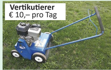
Vertikutierer € 10,- pro Tag