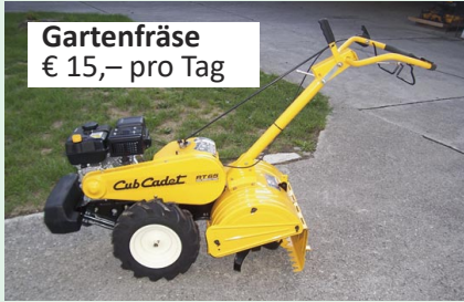
Gartenfräse € 15,- pro Tag