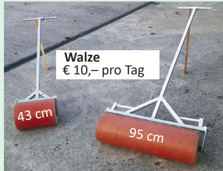
Walze € 10,- pro Tag